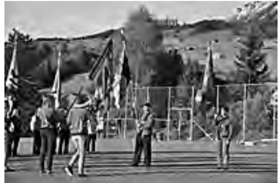
Verabschiedung alte Fahne