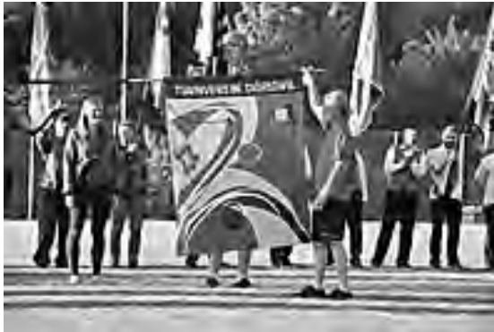
Fahnenspitze nach rechts