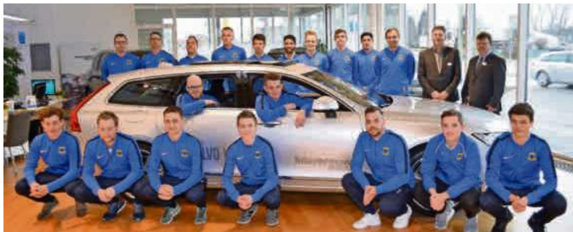
Die Spieler der ersten Mannschaft des FC Bäretswil dürfen sich über neue Trainingsanzüge freuen.

Häusermann Stadion Garage AG Rapperswilerstrasse 66, 8620 Wetzikon WWW.MYVOLVO.CH